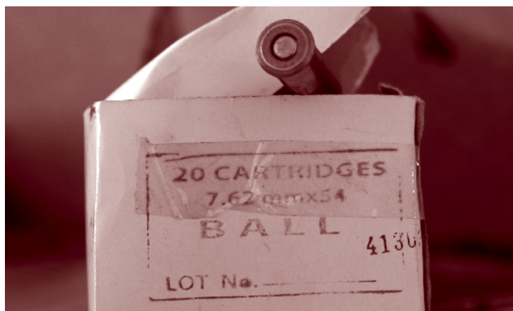
图6.7 (节选) 7.62 x 54R mm弹药的弹壳头处没有任何标记，摩加迪沙，2014年

分国家/地区的概览也能让我们找出哪些类型的弹药在多个地方流通。虽然从给出的数据中只能找出少数的例子，但也再次印证了上面的发现——例如中国和苏丹产的某些型号的弹药似是在受冲突影响的局势下发挥越来越大的作用（见