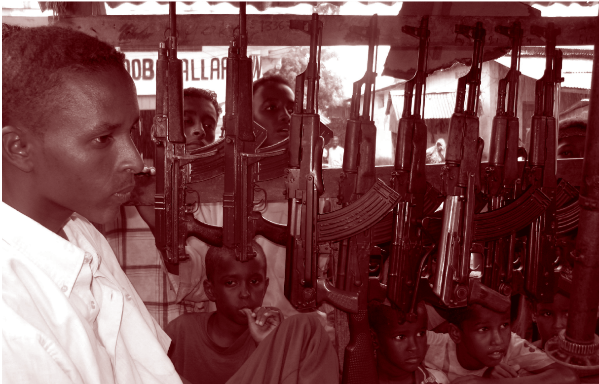
Un traficante de armas que dio sus primeros pasos en el sector a la edad de diez años, en un puesto del mercado de Bakara, Mogadishu, Somalia, junio de 2006.