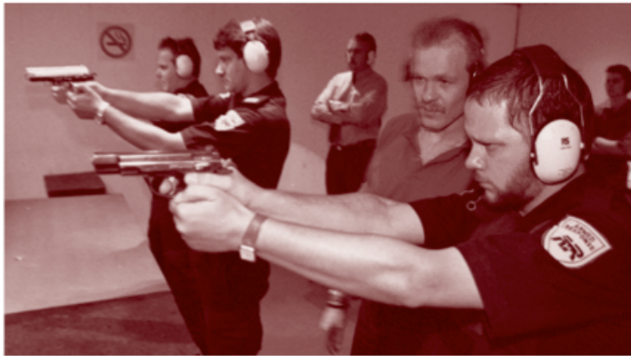
图片说明：1997年6月，南非的约翰内斯堡，一家私人安保公司的武装警卫在用9毫米手枪进行实弹射击训练。

本章揭示的对私人安保公司拥有枪支的管控水准，也毫不例外地符合这一规律。有一些私人安保公司曾涉足非法武器采购和拥有枪支，曾因失窃而丢失过枪支，也曾平民没有招惹他们的情况下动用手中的小武器。不过，获得的有关消息仍然属于传闻，对私人安保公司拥有和使用枪支的监管也只是在个别孤立案例中有所进步，而且只是对一些纠正广为知晓的滥用枪支不当行为的案例。关于私人安保公司拥有枪支的数量和种类却很少报道或知之甚少。在很多国家，在管理和保护私人安保公司拥有的武器以及私人安保公司人员的训练方面，并不存在正式的标准。