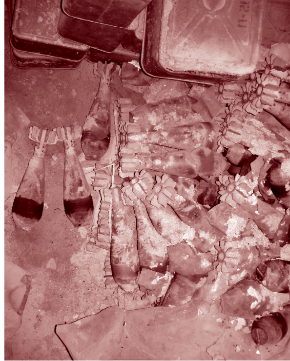
Склад боеприпасов в Пунтленде, Сомали. Запасы были уничтожены в 2009 г. при поддержке благотворительной организации Mines Advisory Group.

Последние успехи в гуманитарной работе с вооруженными группировками подтолкнули аналитиков и практиков к призывам лучше изучить возможность работы с вооруженными группировками по вопросам нераспространения стрелкового оружия. Целью такого диалога было бы обеспечение того, чтобы вооруженные группировки соблюдали международное гуманитарное право, международное право в области прав человека и другие применимые стандарты при использовании, хранении и владении стрелковым оружием.