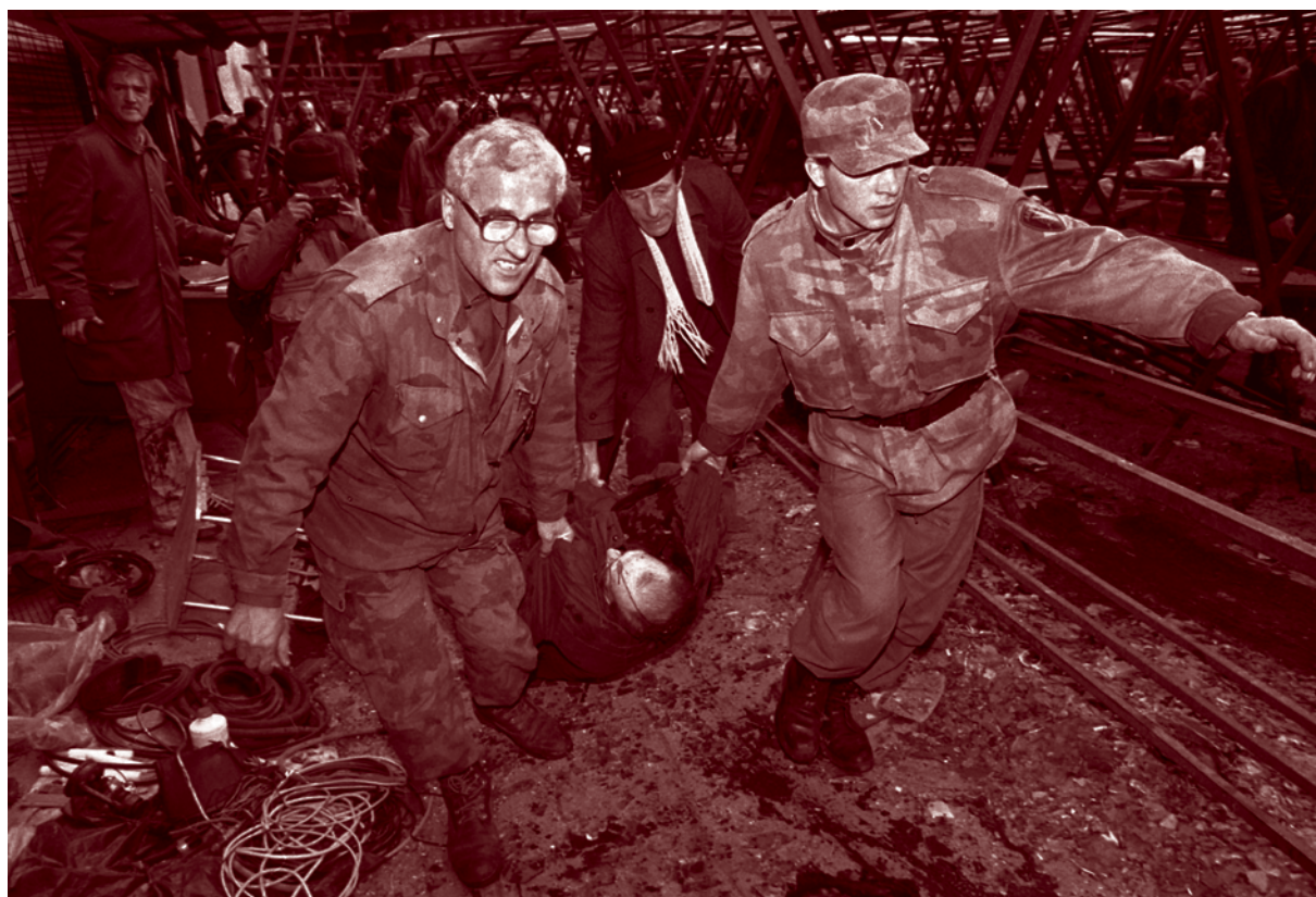
Soldados da Bósnia e um pedestre recolhem o corpo de uma vítima ataque com morteiro contra o mercado principal do centro da cidade de Sarajevo em fevereiro de 1994.

Os sistemas de armamentos portáteis estão amplamente disseminados entre grupos armados não estatais e a opacidade do mercado negro dificulta verificar o número exato de grupos armados que possuem esse material. No entanto, há evidência suficiente para se afirmar que dezenas desses grupos possuem numerosos armamento portátil teleguiado. Muitos desses grupos