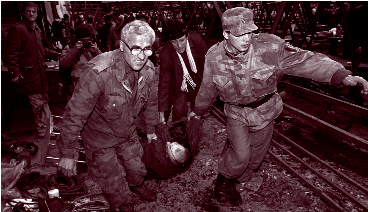
يحمل جنود بوسنيون ومنتفح جثمان ضحية قذيفة هاون في هجوم على السوق الرئيسية لسراييفو في فبراير/شباط ١٩٩٤.

تحوز المجموعات المسلحة غير الحكومية نظم الأسلحة الخفيفة على نطاق واسع. إن الإعلام المسيس وانعدام شفافية السوق السوداء يجعلان من الصعب التحقق من دقة عدد المجموعات المسلحة التي تمتلك نظماً كهذه، لكن ثمة ما يكفي من الدلائل على أن لدى العشرات من هذه المجموعات العديد من الأسلحة الخفيفة الموجهة، كما تنتج العديد من هذه المجموعات أسلحتها الخفيفة الخاصة بها، ومن ذلك مدافع الهاون وقاذفات إطلاق القنابل والصواريخ. وما لبث تعقيد هذه الأسلحة يزداد وكذلك الخطر الذي تمثله.