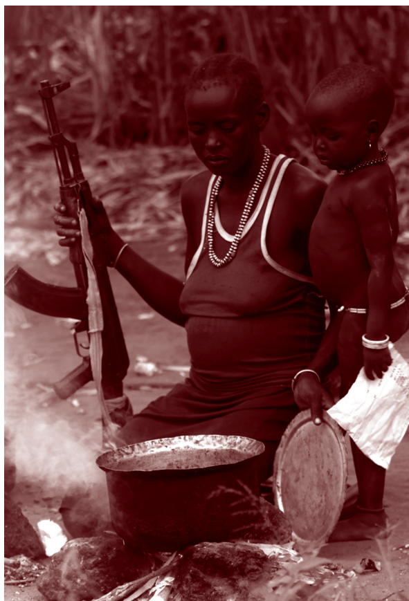
Женщина, вооруженная автоматом Калашникова, готовит ужин вместе со своим ребенком в Рубмеке, в 900 км к югу от Хартума, в сентябре 2003 года.