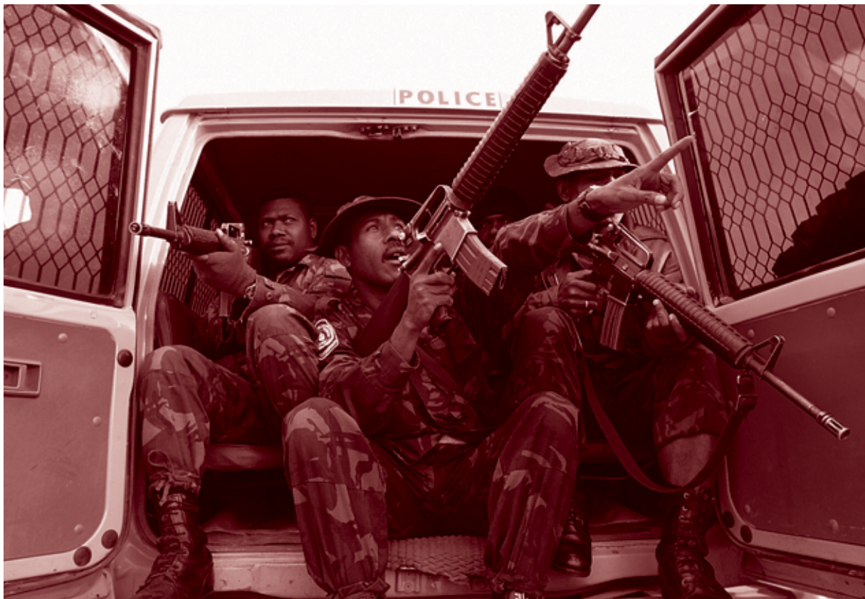
La police de PNG brandit des M-16 lors d'une patrouille de rue à la recherche des gangs raskols en août 2004.

La violence armée en Papouasie Nouvelle-Guinée n'est pas répartie de façon homogène, mais est plutôt concentrée dans certaines zones. En effet, Port Moresby —le centre urbain du pays qui connaît la croissance la plus rapide, avec une population qui dépasse 300 000 habitants— représente aujourd'hui plus de 30 pour cent de tous les crimes enregistrés au niveau national, bien que la ville ne rassemble que 5 pour cent de la population du pays. Une large part de la criminalité se concentre dans des ensembles de squats où le taux de chômage est élevé et où les services publics manquent. La situation dans les Highlands du Sud, qui peut être considérée comme la province la plus troublée du pays, est tout aussi déconcertante. Les dernières décennies ont vu un déclin des services publics accompagné d'une recrudescence alarmante de la violence armée, dont une grande partie coïncide avec le début d'importantes activités d'extraction de ressources.