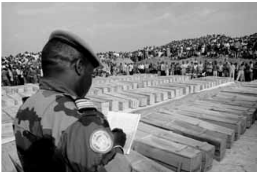
Un pacifista de las Naciones Unidas, toma nota en una fosa común en Gatumba, Burundi, en agosto de 2004.

Las bajas humanas en conflictos armados, por lo tanto, es significativamente más alta que el número de los que son asesinados en violencia directa. Muertes indirectas, consecuencia de los combates, tales como enfermedades, problemas físicos y inanición, generalmente son más numerosas que las causadas en las muertes directas de conflictos. Los datos sobre tales tasas de mortalidad son limitados; por lo tanto, los estudios de caso sugieren que las tasas medias brutas de mortalidad en los países de África Sub-sahariana afectados por conflictos representan más del doble de las tasas de mortalidad natural esperadas, y en algunos agrupamientos de refugiados éstas son más de ocho veces más altas. Estos factores destacan la verdadera magnitud del impacto del conflicto sobre poblaciones enteras y especialmente sobre los grupos más vulnerables. Las cifras por muertes indirectas, de este modo, están lejos de ser alcanzadas por los números de muertes directas de combates.