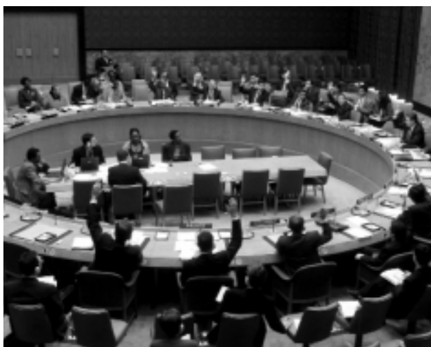
O Conselho de Segurança adota por unanimidade a Resolução 1343, que volta a impor o embargo de armas à Libéria, em razão do apoio deste país aos rebeldes armados da vizinha Serra Leoa (7 de março de 2001).

Apesar de ser um internacionalmente discutido, a regulamentação da posse de armas por civis existe em muitos países africanos.