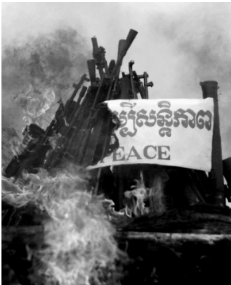
Quase 7.000 armas leves fundidas no Camboja, marcando o início da Conferência das Nações Unidas sobre Armas Leves (9 de julho de 2000)