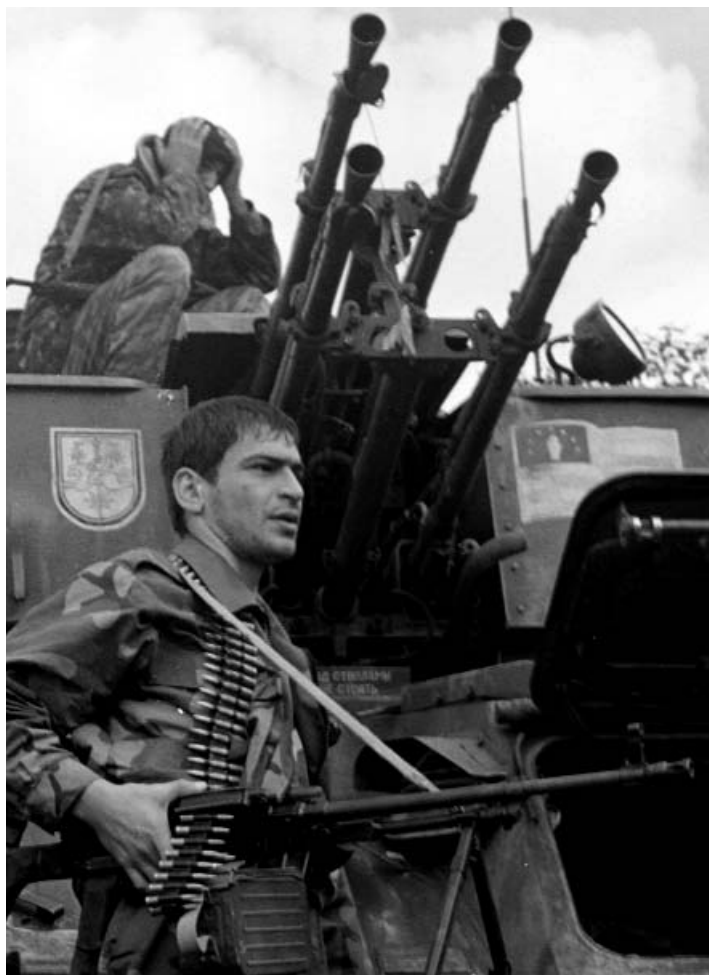
Soldado de Abkhazia en el Cañón de Kodori, que separa Abkhazia de Georgia.

Como muchas de las guerras que acompañaron el final de la Guerra Fría, los conflictos de independencia de Georgia no consistieron en una única guerra, sino más bien en una serie de conflictos étnicos y políticos superpuestos, conflicto de Ossetia del Sur, y el conflicto de Abkhaz. Estos conflictos armados no fueron las guerras internas más largas ni más mortíferas de principios de la década de 1990, pero fueron profundamente afectados por la descontrolada proliferación y disponibilidad de armas pequeñas y ligeras.