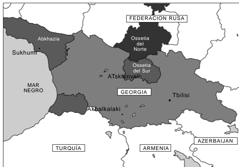
Mapa 6.1 República de Georgia

Durante los conflictos georgianos de independencia, la disponibilidad de armas pequeñas cambió dramáticamente. En el periodo inicial entre 1989 y mediados de 1991, habían pocas armas pequeñas disponibles y las fuentes de aprovisionamiento eran principalmente no militares. Desde mediados de 1991 en adelante, sin embargo, las instituciones públicas se desintegraron, incluyendo las fuerzas armadas rusas. Las armas pequeñas y ligeras de pronto se volvieron ampliamente disponibles a través de filtraciones masivas provenientes de las bases militares rusas y a través de un próspero comercio regional que involucraba a Azerbaiján y a Armenia, tal como lo demuestran los decrecientes precios de las armas pequeñas después de 1991.