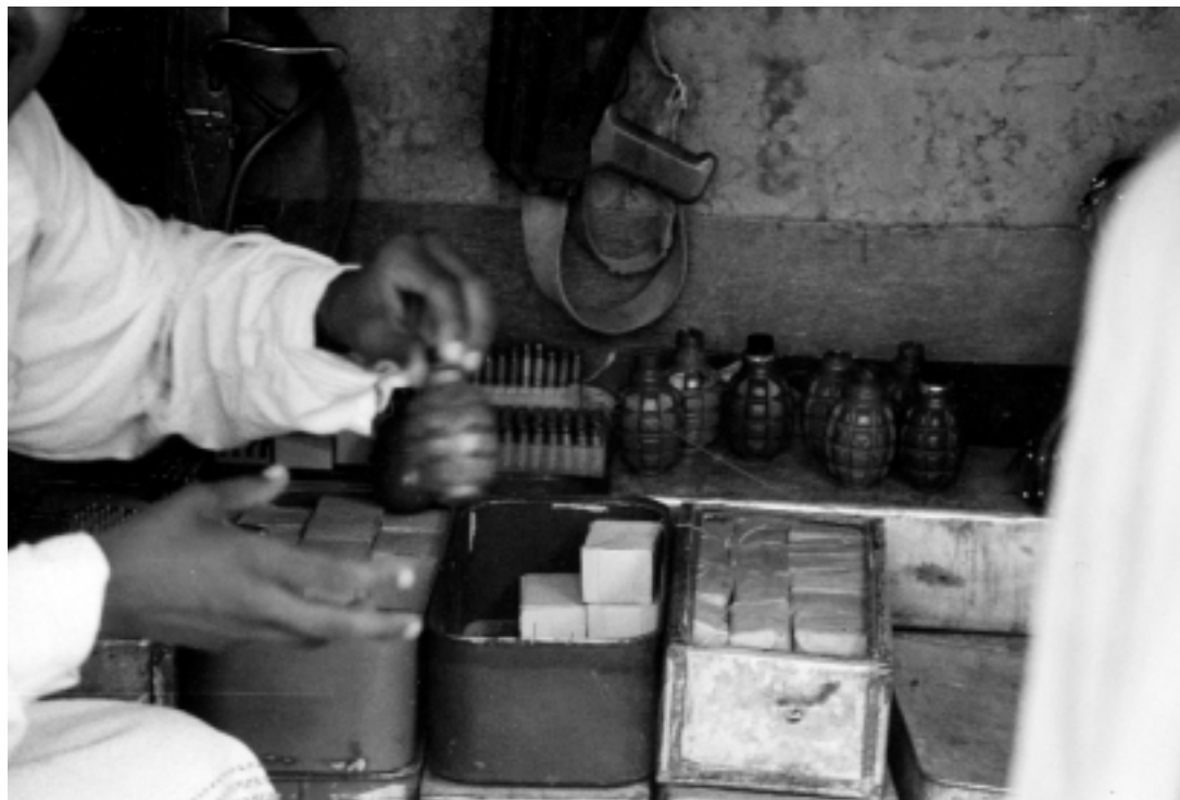
© Derek Miller Waffenverkauf auf der Ladefläche eines Lastwagens.

Waffen spielen eine Rolle als Instrument in einem Konflikt, sind aber auch Ausdruck der Identität des Besitzers.