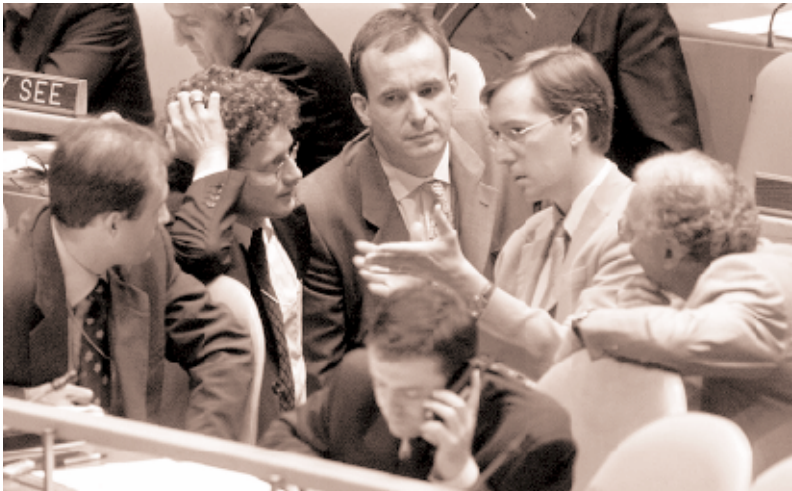
Multilaterale Diplomatie führte zu einem von allen Beteiligten getragenen Programme of Action, doch zu keiner festen Zusage, ein rechtlich verbindliches Instrumentarium auszuhandeln.

Die Mitwirkung von NROs an der 2001 UN Conference verstärkte ihre Möglichkeiten, sich in Zukunft noch erfolgreicher an der Lösung des Kleinwaffenproblems zu beteiligen.