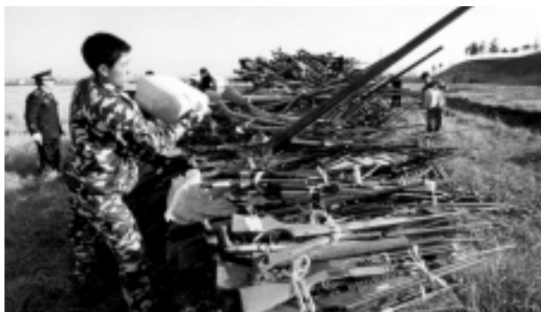
La policía china se prepara para destruir algunas de las 5.000 armas confiscadas en el municipio de Huaian, en la provincia de Jiangsu, en 2 de enero de 2002.

por una nueva producción. Con el estoque mundial creciendo 1% al año a través de nueva producción, es la re-transferencia de armas de segunda mano que modela más la distribución global. Cuando los datos están faltando, los precios de armas son la raíz vital de criterio sobre alteraciones de estoque. Como el examinado aquí por primera vez, el precio alto es una señal roja que avisa sobre situaciones al margen de la degeneración rápida. Los precios deben ser la única manera de determinar si las armas de fuego son comunes o escasas, si el contrabando es eficiente o los embargos están funcionando, principalmente donde la posesión de arma de fuego es ilegal.