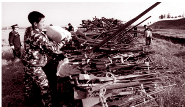
La police chinoise se prépare à détruire quelques uns des 5000 fusils confisqués le 2 janvier dans la région de Huaian, province de Jiangsu.

En 2001, il existait au moins 639 millions d'armes légères dans le monde, soit une augmentation de 16 % par rapport à la dernière estimation. La catégorie la plus active en terme de détention d'armes à feu reste celle de la population civile. Aujourd'hui, au moins 59 % des armes à feu sont entre les mains de civils, ce qui représente 378 millions d'armes à feu, un chiffre en augmentation de 25 % par rapport à la précédente estimation, en raison essentiellement de données plus complètes et de meilleures techniques de comptage.